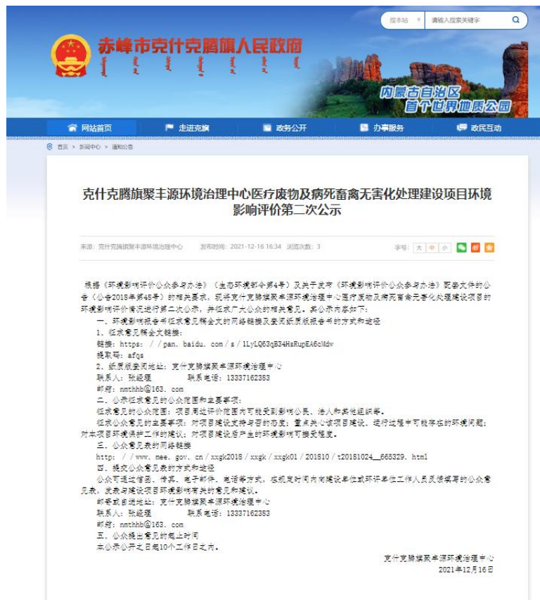
图 3-1 项目环境影响评价第二次公示网上截图

建设单位采取网络公示形式，于2021年12月16日-2021年12月28日（共10个工作日）在“赤峰市克什克腾旗旗人民政府”网站（ http://www.kskt.gov.cn/xwzx/tzgg/202112/t20211216_1760304.html ）进行了项目环境影响报告书征求意见稿公示（环境影响评价第二次公示），公开方式及公示时间均符合《办法》第十条要求。第二次网络公示截图见图3-1。