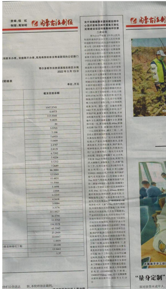
图 3-2 第一次报纸公示情况 (2022 年 5 月 13 日)