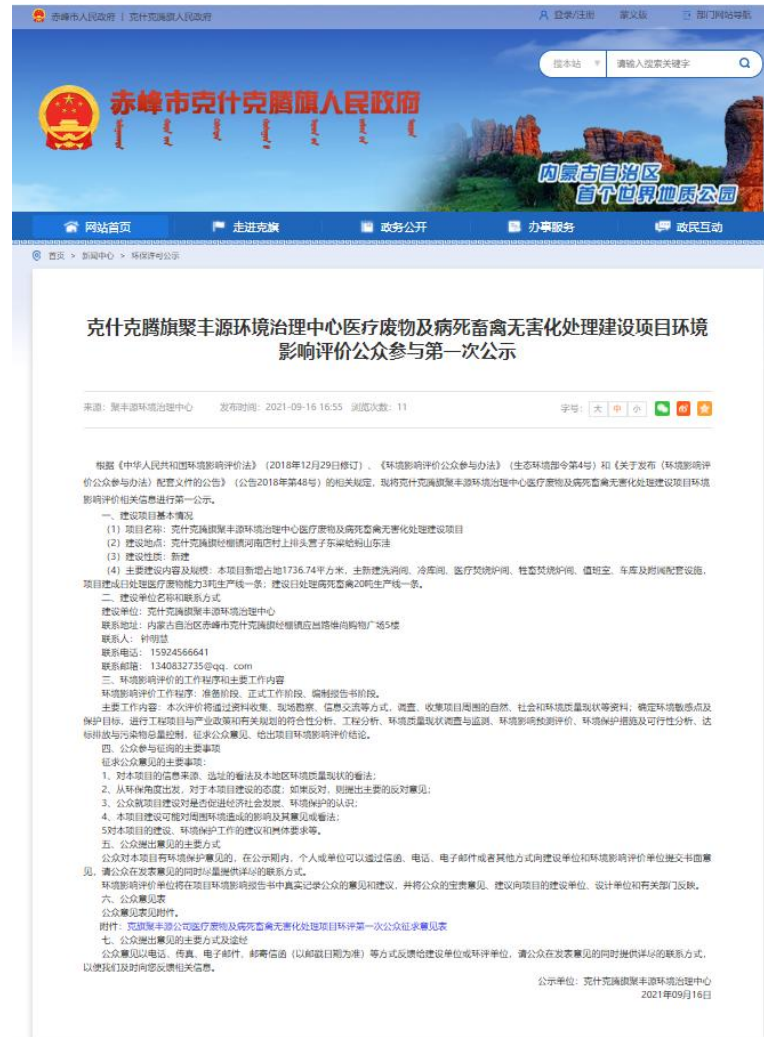
图 2-1 媒体公示情况