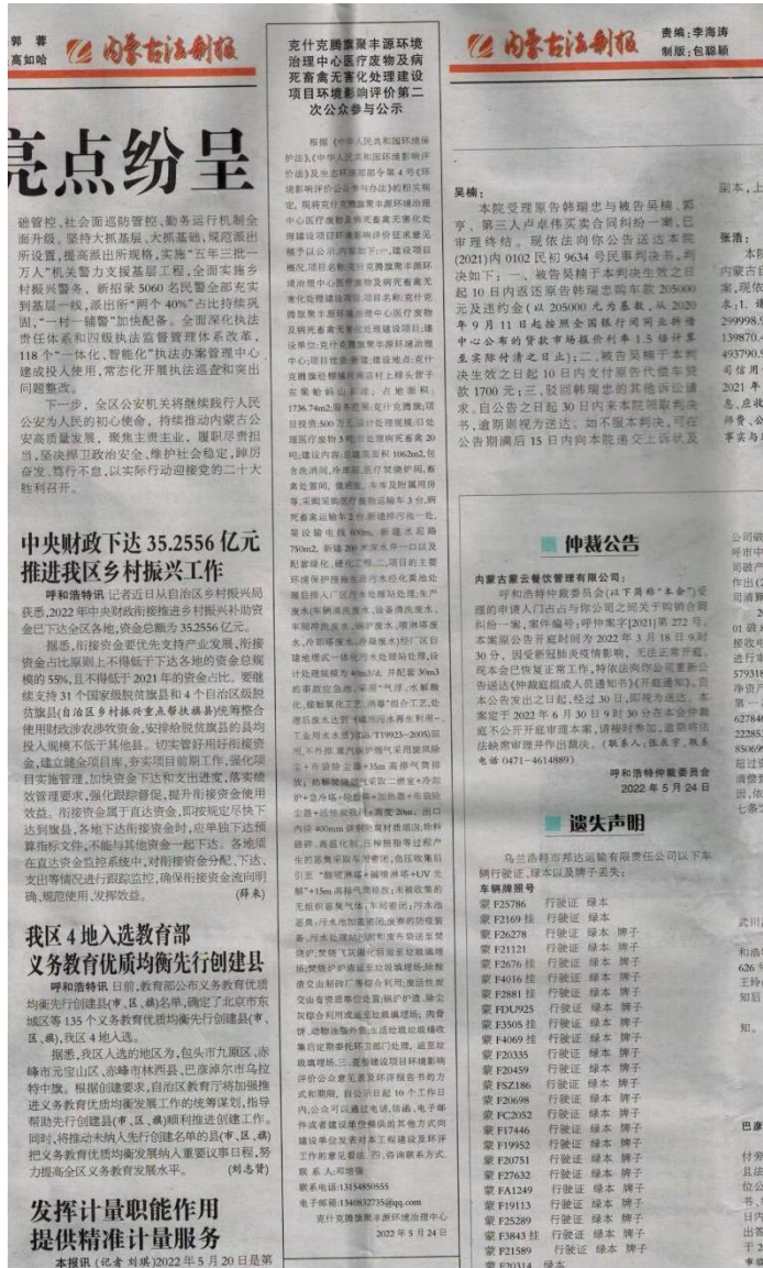
图 3-3 第二次报纸公示情况 (2022 年 5 月 24 日)