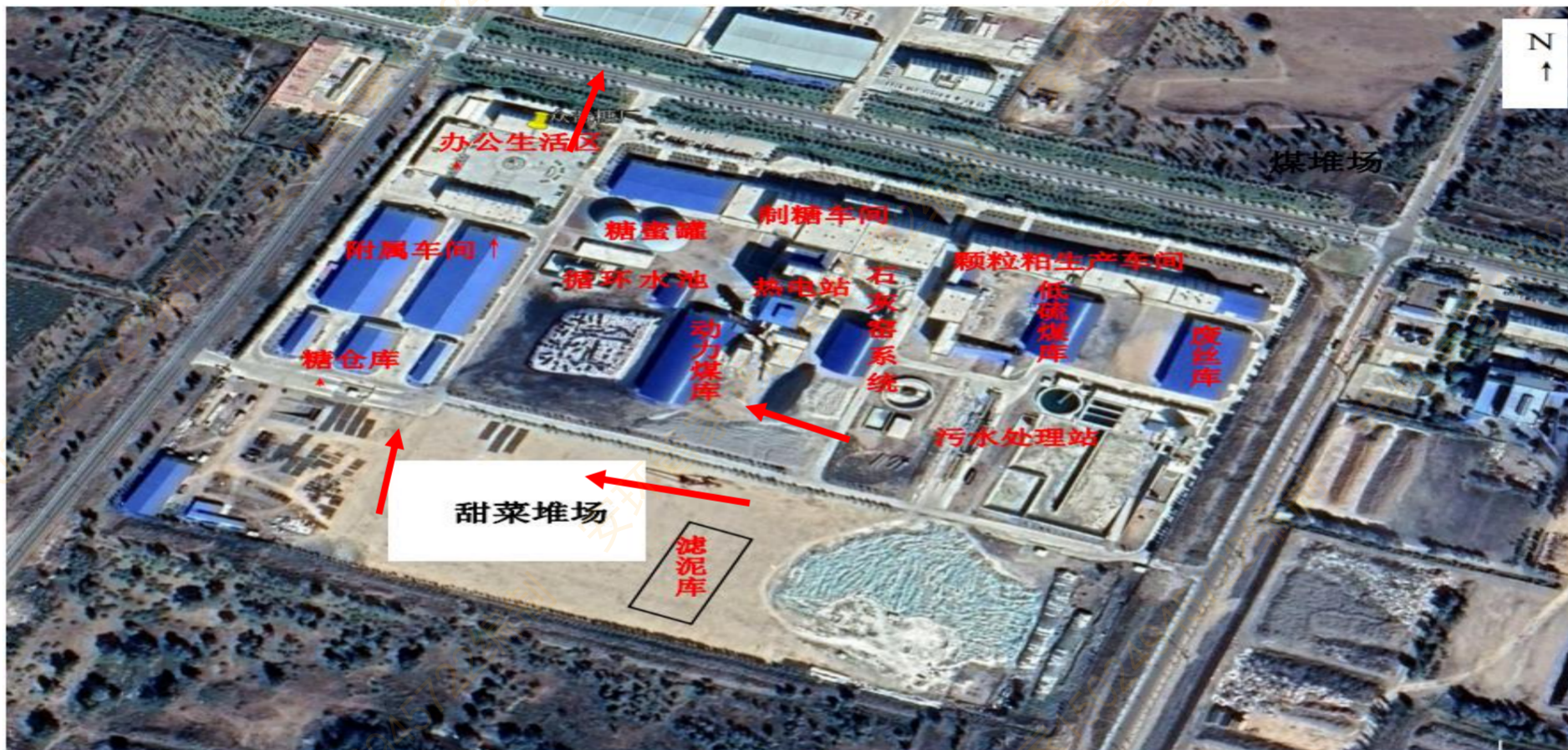
附图2：企业内部、外部紧急逃生应急疏散路线图