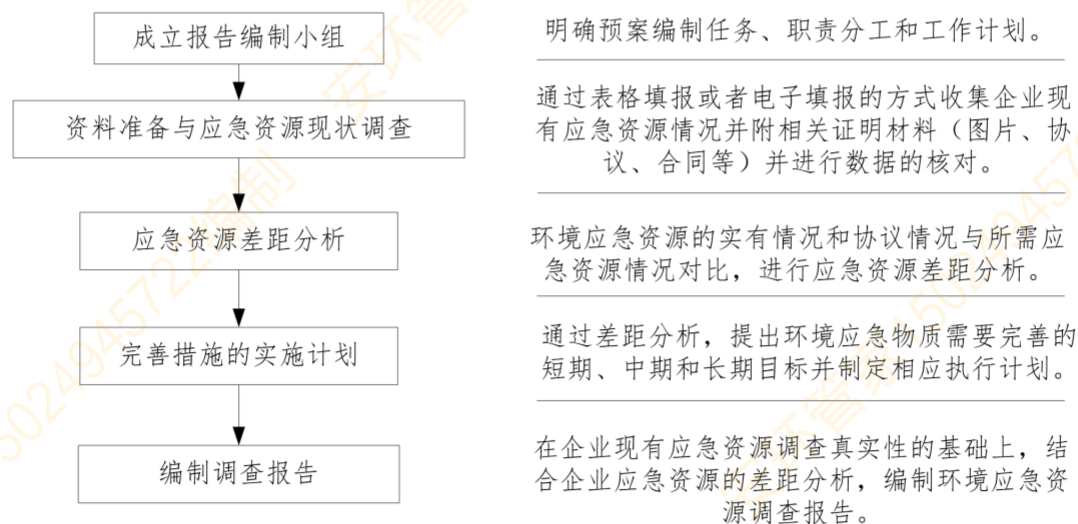
图 2.6.1 应急资源调查工作流程