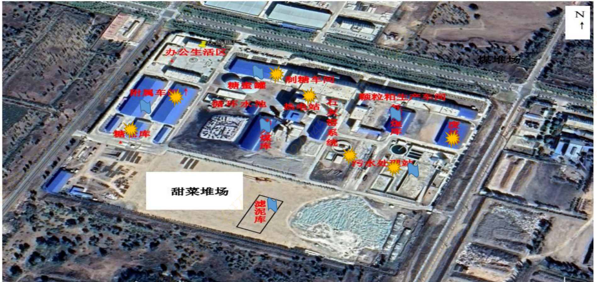
附图 1：平面布置及环境风险源分布图